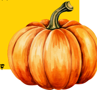
שמקרה רע גור דינינו

את הדבור שלנו, את המעשים שלנו-העולם כלו ישתפר.