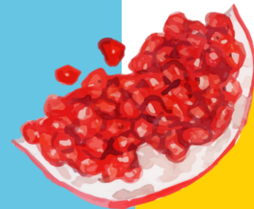
שיקבו זכויותינו כרמון

ועוד הוסיף: "הרבה נועים, ומשתמשים בניס ההפוך מזה שהם צריכים לו" מיחס לדבי שמחה באים מפשיססחה, אדנו"ר חסידי [פולין 1765-1827]