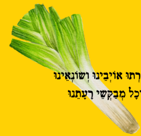
שיקרבו אויבינו ושונאינו וכל מבקשי רצתנו

ראש השנה זה קצת כמו יום הולדת. לני אנחנו חוגגים וחוגגות? המסורת מספרת שבבראש השנה, מוש 1-א. בתשרי, נברא העולם ונבראו גם אדם וחוה. לכן, לפי סיפור זה, אנחנו חוגגים וחוגגות יום הולדת לכולנו ולכל מי תהה ששביבנו. בעיני, המסורת היהודית מזמינה אותנו לברוא את עצמנו ואת עולמנו מחדש בכל שנה בראש השנה. איך נושאים את זה?