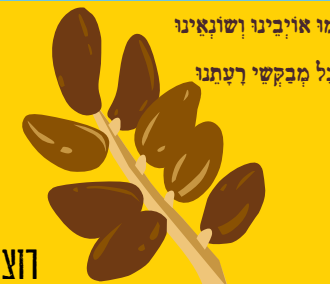
שיקמו אויבינו ושוואינו

על פי הרבי מצידנוביל, מאוד עיניים, פרשת האזינו.