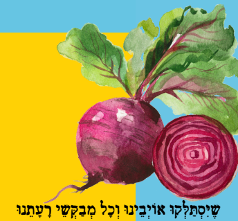
שיסמלקו אויבינו וכל מבקשי רשענו

לכל אחד צריכים להיות שני ניסים, ובהם ישתמש כשיצטרך לכן. בניס אחד יהיה כתוב – "בשבילי נברא העולם" (משנה, סנהדרין, פרק ד משנה ה), ובניס השני – "ואנכי עפר ואפר" (בראשית יח, כג).